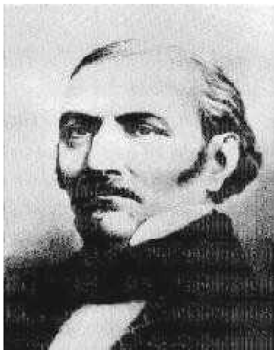
Hippolyte Leon Denizard Rivail Allan Kardec 03 de outubro de 1804 – 31 de março de 1869

Apêndice do Curso de Passes da Sociedade Jauense de Estudos Espíritas – 2004 –